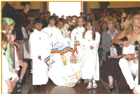
La Procession des offrandes

Le dimanche 12 juin, après avoir préparé pendant deux ans leur première Communion, 32 enfants ont reçu, au cours de la messe dominicale dans le Sacrement de l'Eucharistie, le Corps et le Sang de Notre seigneur Jésus-Christ .