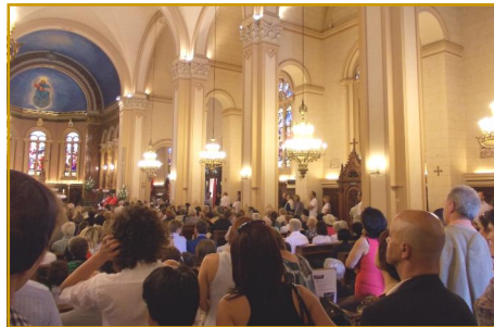
Une église comble