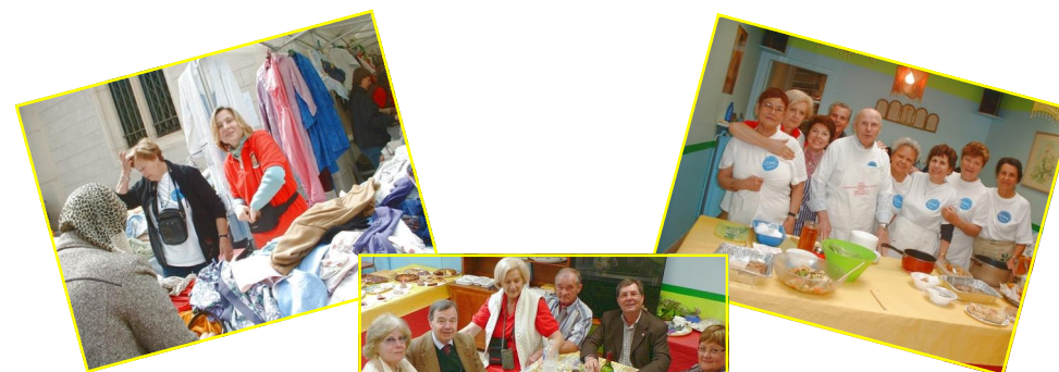
Affiche Bhx Ozanam

La Conférence St. Vincent de Paul de la paroisse St Charles, a organisé sa Kermesse de printemps qui a eu lieu les 9 et 10 avril derniers. Cette manifestation a obtenu un succès bien supérieur à toutes celles précédentes grâce notamment à la collaboration passionnée et efficace des membres et bénévoles ainsi qu'à la générosité de nombreuses personnes et entreprises monégasques.