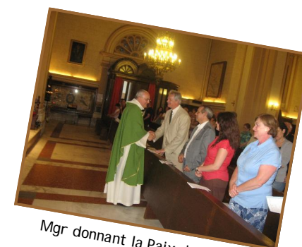
Mgr donnant la Paix du Christ