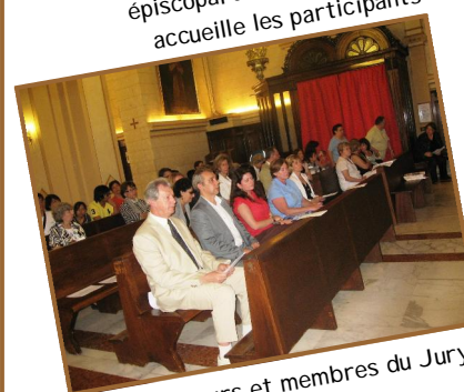
Organisateurs et membres du Jury