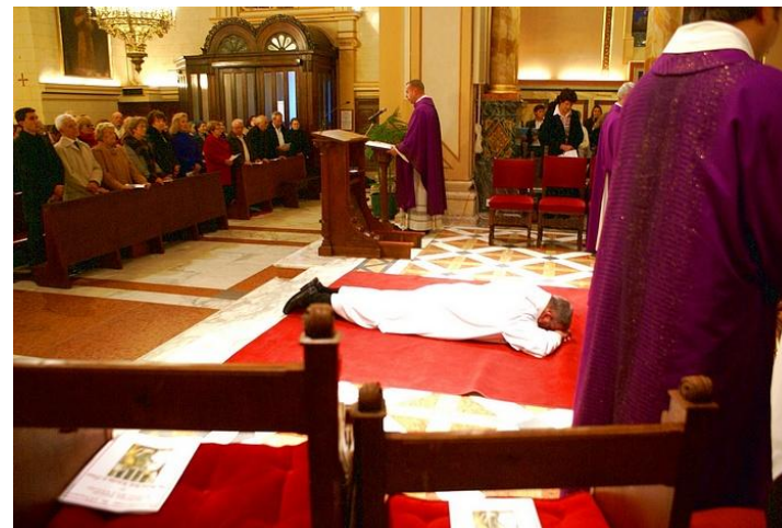
Prostration de l'Ordinand pendant la supplication litanique