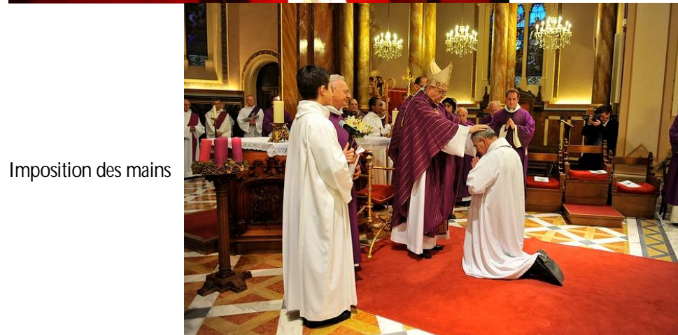
Imposition des mains