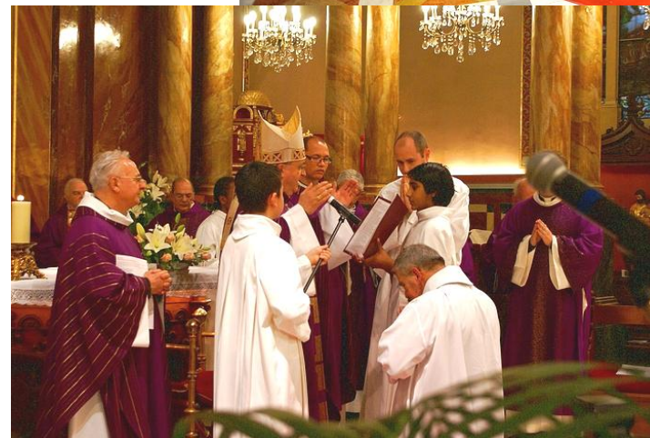
Prière de l'Ordination